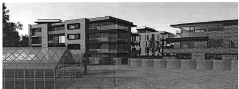
Het project aan de rand van het Zoniënwoud wordt als te megalomaan beschouwd.