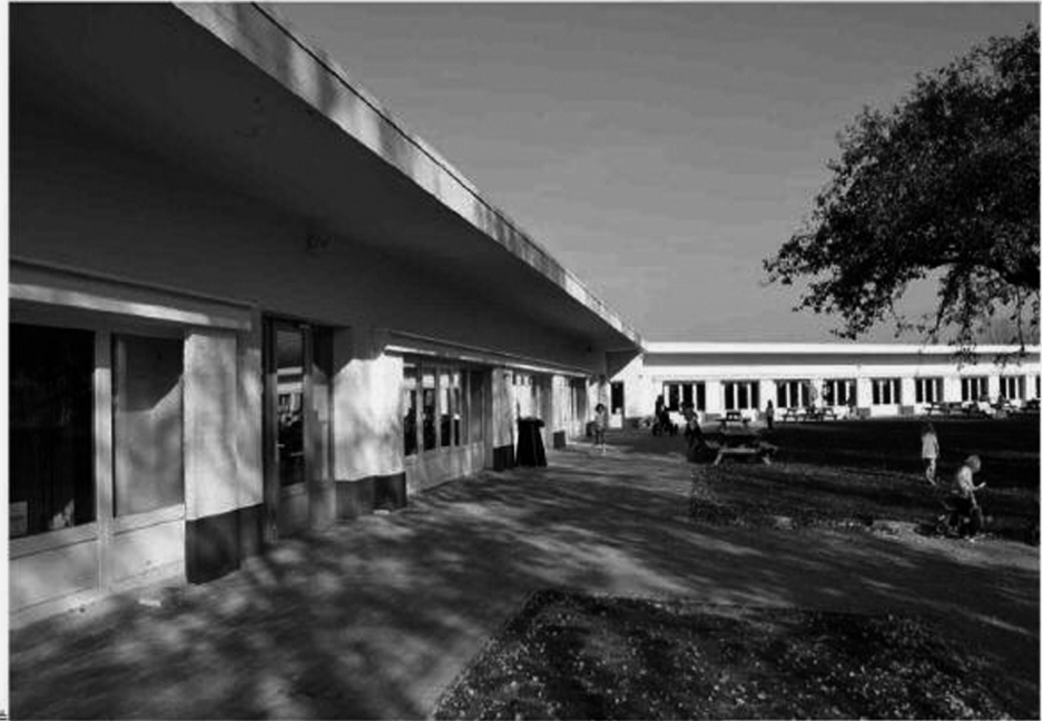
■ Door de renovatiewerken lag de werking van het centrum stil.

De werken bestonden uit een volledige herinrichting van twee sanitairblokken. Er werden nieuwe vloeren gelegd en de buitenmuren werden geïsoleerd, zodat condensatievocht geen kans meer krijgt. "Door de renova-